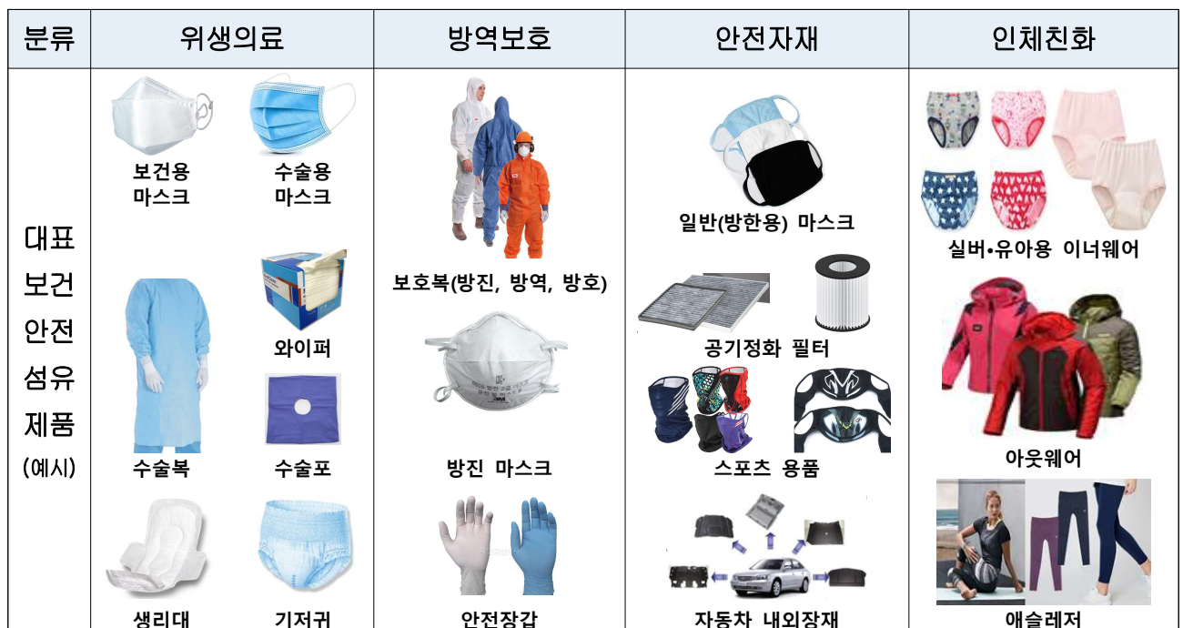
< 보건·안전섬유제품 예시 >